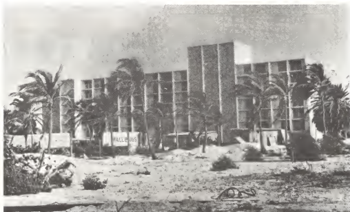
Tereno despues, unda e mahestuoso Aruba Holiday Inn Hotel a reis for di tera, pa dorna nos playanan unico den Caribe.